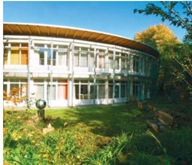
Zehn individuelle und wohnliche Einzelzimmer

Wir begleiten schwerkranke Menschen, deren fortschreitende Erkrankung durch eine medizinische Behandlung nicht mehr aufgehalten werden kann und deren Versorgung im häuslichen Bereich nicht möglich ist. In dieser Situation nehmen wir Sie als Gast auf. Ihre Angehörigen und Freunde sind jederzeit willkommen. Für Ihre umfassende Begleitung sorgt ein interdisziplinäres Team. Individuelle Unterstützung erhalten Sie und Ihre Angehörigen auch durch ehrenamtlich Mitarbeitende. Die medizinische Behandlung erfolgt über Ihren Hausarzt oder durch kooperierende Ärzte, die palliativmedizinisch spezialisiert sind.